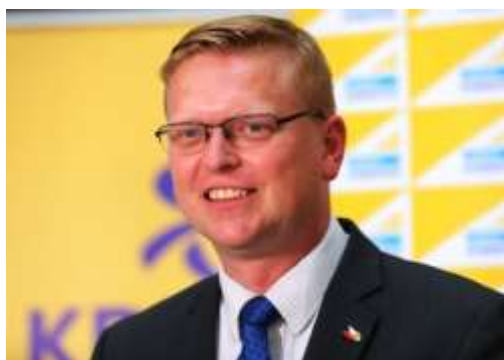
Pavel Bělobrádek (předseda KDU-ČSL)

Většina z výše jmenovaných jsou dále také členy v německo-českém diskusním fóru a také v německo-českém fóru mládeže. Pavel Bělobrádek, předseda KDU-ČSL, jim posílal zdravici. Mimochodem, Pavel Bělobrádek, předseda KDU-ČSL, za které Daniel Herman působil jako ministr kultury, uvedl do života slovní termíny “geografické Sudety” a “politické Sudety”. K nim přiřadil Šumavu i Brno a dokonce sám sebe označil za sudetského Čecha.